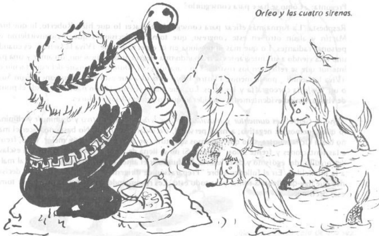
Orfeo y las cuatro sirenas.

Por eso cada uno de nosotros debe aprender a conocer cual es su defecto predominante y cual es su virtud predominante. Y deberíamos saber meditar. Por ejemplo, tomemos la envidia: ¿Cuántos de nosotros nos hemos dado cuenta y hemos reconocido si somos envidiosos? Claro, cuando miramos a un niño es muy fácil saberlo por la manera como se comporta con su hermanito y con los demás chicos. Pero nosotros tenemos una manera mucha más astuta de manifestar nuestras envidias, y las disfrazamos con otras palabras. Por eso, si hay una chica más bonita que yo, busco la manera de hacerle pasar dificultades. O puedo dar otros ejemplos, ¿no es así?