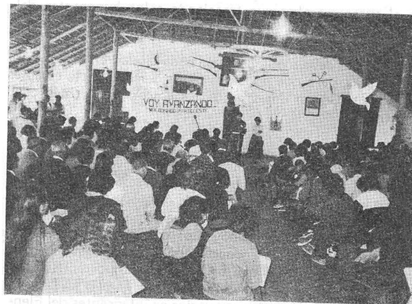
EL PRIMER CONGRESO NACIONAL DE FAMILIAS ¡VIVA LA GENTE!, EN LAS PIEDRAS, URUGUAY (17 Abril '88).