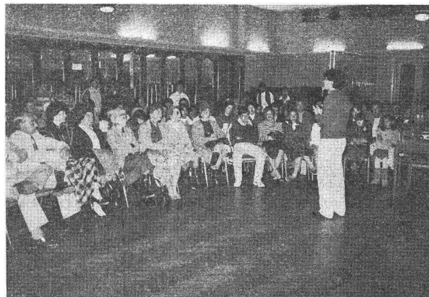
EL DESPERTAR DE UNA NUEVA VOCACION DE SERVICIO EN LAS FAMILIAS.

En esa forma se ha venido cumpliendo no solamente el objetivo de ayudar a la integración entre las familias latinoamericanas, sino el de contribuir a la integración y la dignificación de la familia y sus valores.